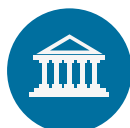
INTRODUCCIÓN SECTOR PÚBLICO NACIONAL