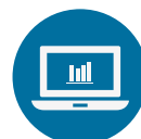
SISTEMAS VINCULADOS A LA ADMINISTRACIÓN FINANCIERA